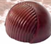
Кафе кафе черный