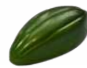
Зеленый чай с мятой