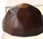
Ром с изюмом